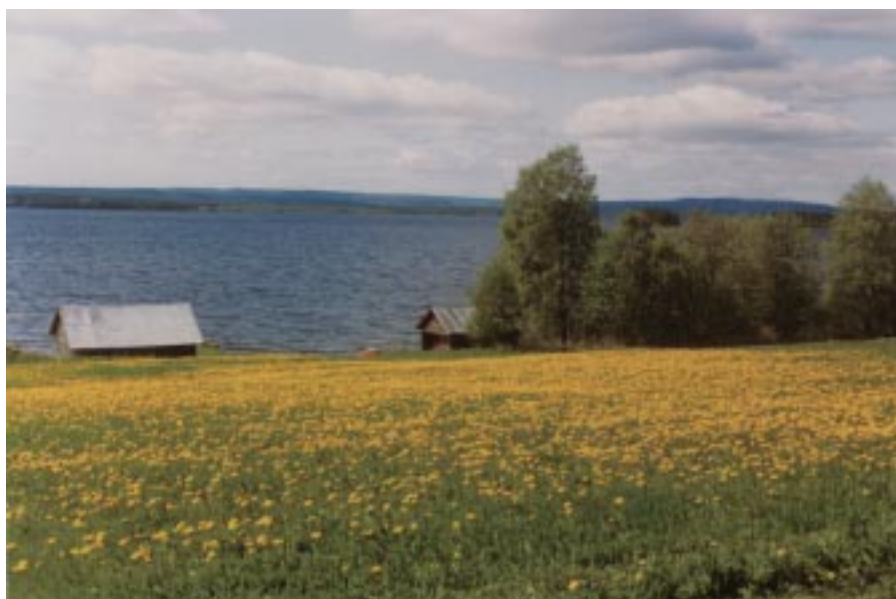
Ströms Vattudal i slutet av maj.

Eftersom denna skrift kan ses som ett komplement till Skolverkets nyutkomna "Handbok för Miljöskola" och till stor del relaterar till denna rekommenderar vi att Ni laddar ner handboken från Skolverkets hemsida på adressen www.skolverket.se/c/miljo/miljoskolor . Det är också viktigt att Ni laddar ner riktlinjer och andra viktiga dokument. Ni kan också gå till vår hemsida agenda21info.just.nu varifrån länk finns till Skolverkets hemsida.