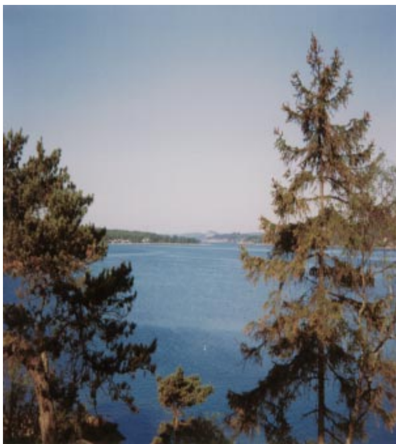
Byfjorden vid Uddevalla en försommardag.

9. Skolverket utfärdar diplom för utmärkelsen Miljöskola om man godkänns. Utmärkelsen gäller i högst tre år. Under dessa tre år kan man göra tillämpliga delar av punkterna 1 - 7 återigen och försöka få behålla utmärkelsen i ytterligare tre år o s v. Skolverket kommer slumpmässigt att kontrollera skolornas arbete.