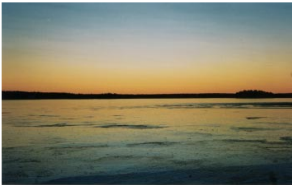
Nationalparken vid Färnebofjärden i december.

5. Framarbeta användbara mål, åtgärder, tidsplaner och kostnadsberäkningar med hjälp av verktyg E i våra material. Målet är att alla elever ska vara delaktiga i att även göra detta, som ett andra steg efter det att de kartlagt ett område. Om man jämför med Skolverkets handbok sid 11 har vi dessutom tagit med kostnadsaspekter, vilka i och för sig ofta är svåra att arbeta med. Anledningen är att det är viktigt för alla att se till olika kostnader då det ofta är de som begränsar arbetet i praktiken. Dock bör man vara medveten om att Skolverkets riktlinjer för utmärkelsen är av sådan karaktär att man kan erhålla utmärkelsen utan att erlægga betydande kostnader, något som är väldigt bra.