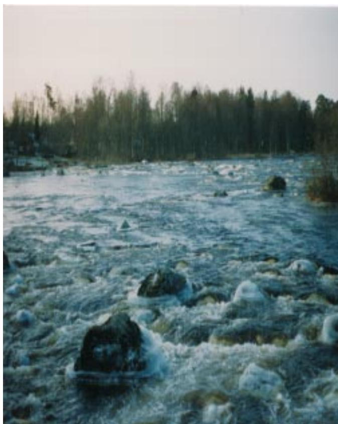
Gysinge strömmar i januari.

Det är också viktigt att på olika sätt få arbetet att vara roligt och belönande. Man ska inte bara behöva “offra sig” för miljön.