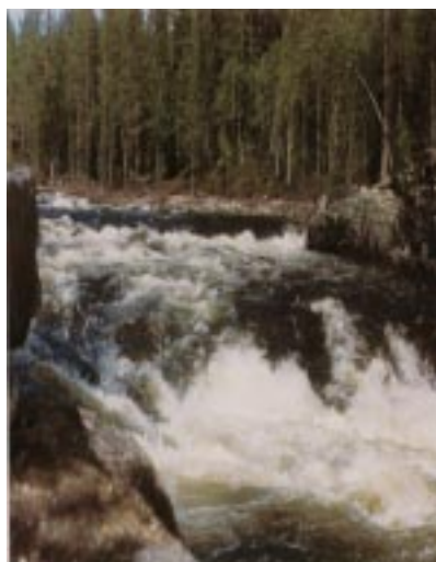
Vårflod i jämtländska skogslandet.

Tanken är att lära sig en del om FN:s stora miljö- och utvecklingskonferens år 1992, benämnd Rio-konferensen. Detta ger en bakgrund till Agenda 21-arbetet. Vidare kan man också ta upp föregångaren till konferensen - Stockholmskonferensen år 1972 - och det gedigna förarbetet till Rio-konferensen, vilket är Brundtland-kommissionens världsövergripande arbete. Övningsuppgiften syftar till att lära mer om några vanliga miljöproblem. I fördjupningsuppgiften fokuseras miljöproblem i anknytning till produktion av el. Diskutera gärna debatten om stängning av kärnkraftverk och vilka energikällor vi bör ha i framtiden.