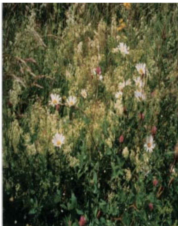
Sommaräng vid Nedre Dalälven.

Även i uppföljningsskedet - precis som när handlingsplanen skapades - är det av stor betydelse att såväl elever som skolpersonal är och känner sig delaktiga. Det är värdefullt för den fortsatta processen.