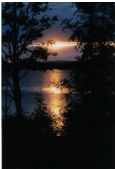
Solnedgång vid Bergviken.

motiverad att göra olika saker. I fördjupningsuppgiften fokuseras till en början elitidrottare och motivation. Sedan breddas fokusen till att även gälla insatser på andra områden än idrott, t ex miljötänkande eller politiska och kulturella insatser. I uppgiftsblad 10 fokuseras vikten av samarbete samt att det ibland finns förhållanden som man helt enkelt inte kan förändra hur än mycket man vill. Det kan till exempel vara att få en ny skolbyggnad då pengar för detta helt enkelt saknas i kommunen.