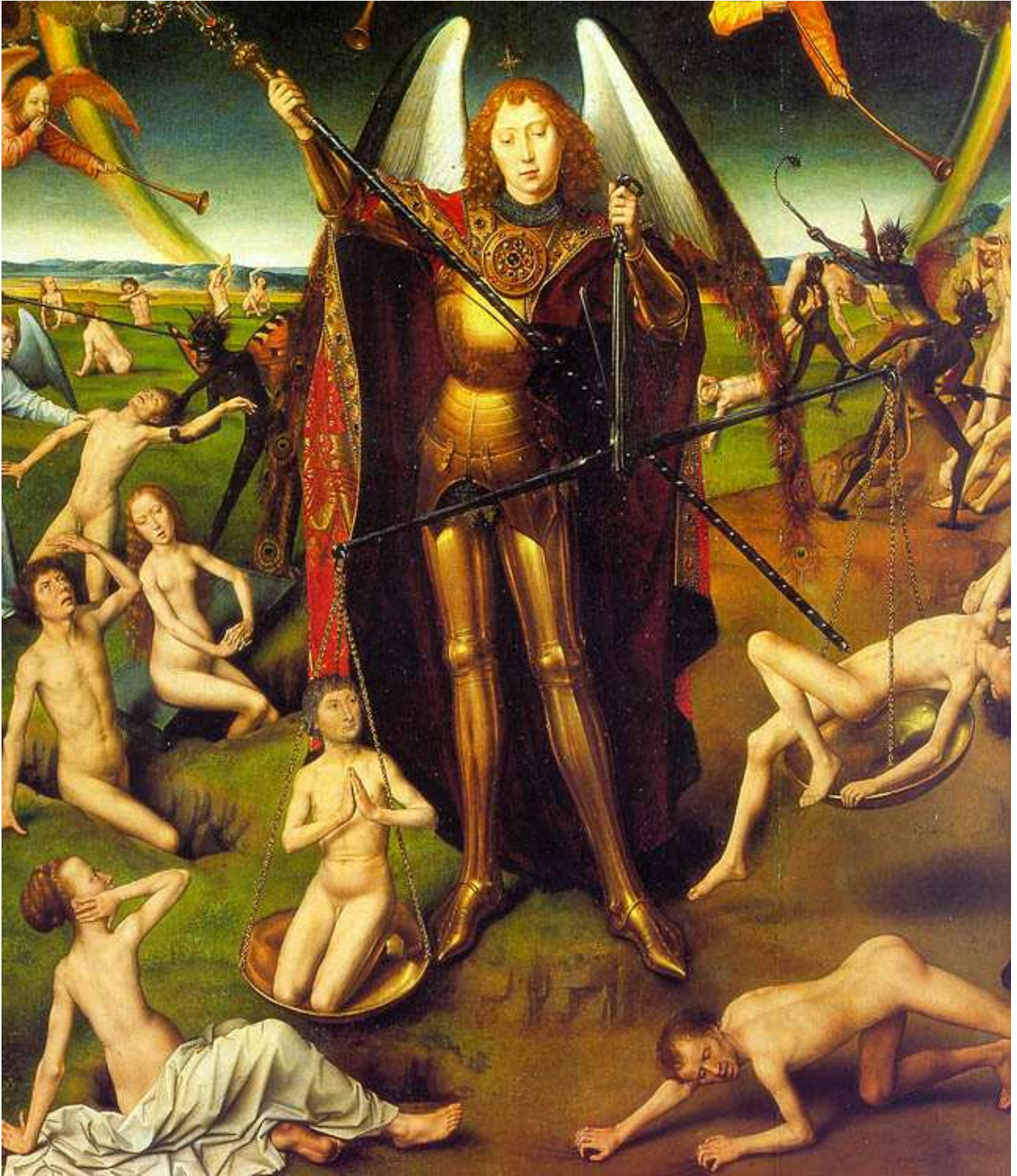
Yttersta Domen , 1472 Hans Memling (c:a 1433 - 1494). När Ärkeängeln Mikael väger de uppståndna har Sankta Bantista en anspråkslös roll på hans högra sida.

Det finns en rad legender om underverk gjorda i Sankta Bantistas namn. De verkar obegripliga för en modern svensk. Lättare att förstå är Bantista-hymnen, som lånat sin melodi till Lucia-sången. Den sjungs dagligen av bantister i